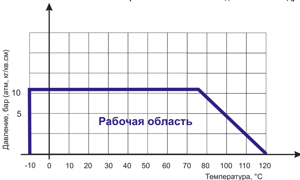
Диаграмма Давление / Температура для задвижки клиновой ABRA-A40-10G с обрезиненным клином и невыедным штоком Ду200-600 Ру10:

Диаграмма определяет рабочую область для задвижек клиновых чугунных с обрезиненным клином в координатах Давление (в барах приборного) / Температура (° C).